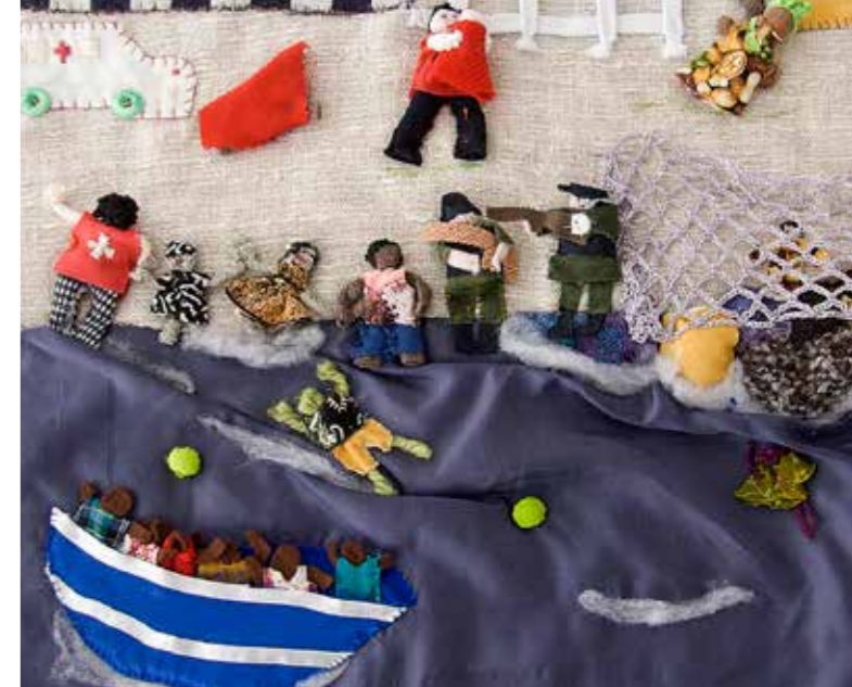
On the "Good" Side of the Fence | Ar ochr "Dda" y Ffens , Antonia Amador, 2014/2015, replica, 2016, Ffotograff | Photo Colin Peck © casgliad Conflict Textiles collection

"In the aftermath of violence and atrocities, we usually understand truth in terms of official testimonies, legal evidence, or estimates of the number of casualties. The textiles in Stitched Voices urge us to consider the no less important truths that lie beyond such indicators and categories."