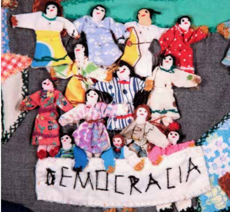
We want democracy | Rydym am ddemocratiaeth , Vicaria de la Solidaridad, 1988, Ffotograff | Photo Martin Melaugh @ casgliad Conflict Textiles collection

Steffan Jones-Hughes, Curadur | Curator, Canolfan Celfyddydau Aberystwyth Arts Centre