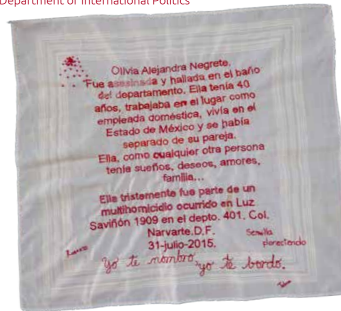
Embroidered Mexican Handkerchief | Cadachau poced Brodiog Mecsicanaidd , Cymundod Fuentes Rojas Collective, c.2015, Ffotograff | Photo Danielle House

Dr Berit Bliesemann de Guevara, Adran Gwleidyddiaeth Ryngwladol | Department of International Politics