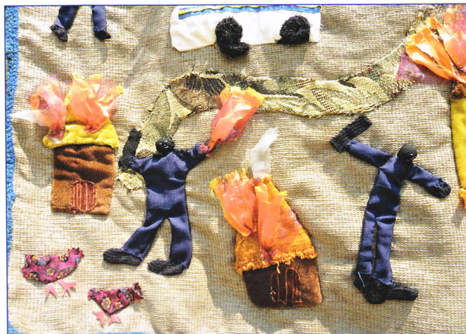
El día que jamás olvidaremos (detalle)