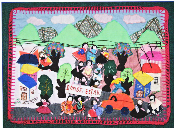
¿Dónde están? Anónima, Chile – inicio década 80. Colección Theresa Wolfwood, Victoria, Canadá. Foto: Martin Melaugh

Para muchas mujeres fue también un modo de ganarse la vida,