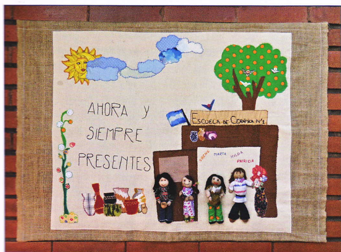
Los Derechos Humanos y la Memoria. Confeccionada por 13 alumnos de la Escuela de Cerámica N° 1 de Buenos Aires, 2013. Proyecto articulado por 3 profesoras de la Escuela, Adragna Liliana, Luppo Analía y Prósperi Liliana.

Durante el tiempo que estas exposiciones se expusieron en el Parque de la Memoria y en el Museo de la Mujer , se realizaron talleres de confección de arpilleras, tours guiados y otras actividades ad-hoc organizadas por los espacios respectivos. El objetivo era que los visitantes pudieran hacerse parte de la experiencia textil. A partir de estas actividades nuevos rumbos, nuevas estelas y nuevos caminares se han gestado los cuales han materializado gracias a los talleres impartidos. Destaco la arpillera que se produjo en el Parque de la Memoria hecha por 14 alumnos de la Escuela de Cerámica N° 1 . Tres profesoras