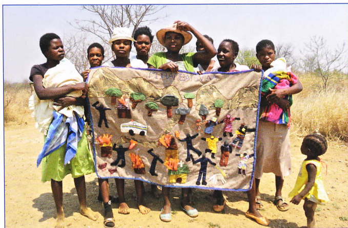
El día que jamás olvidaremos / The day we will never forget Las 'chicas' de Killarney, Zimbabwe, 2011.

ya que la ausencia de quien aportaba el sustento familiar les obligó a nuevas formas de ingreso. Gracias a la solidaridad internacional, las arpilleras lograron salir del país y con ello aseguraron ingresos mínimos y la difusión de sus causas. Las piezas textiles en estas exposiciones no respondieron a un concepto único; tampoco a una narrativa lineal y menos a una técnica clásica en materia de costura, generalmente relegada a la labor doméstica de la mujer y al rol social subalterno que se le ha asignado. La unidad de ellas se centró en la fracturación de todos sus elementos conceptuales, narrativos, estéticos y de costura. Las exposiciones tomaron forma siguiendo dichas fracturas. La selección de piezas, 98 en el Parque de la Memoria y 14 en el Museo de la Mujer representaron el nombre de cada exposición.